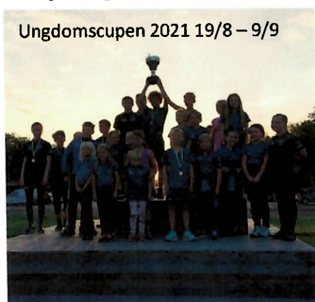
Ungdomscupen 2021 19/8 – 9/9

OL-träningarna satte igång 24/3. Vårterminen avslutades 9/6 med lagtävlingar, korb och glass. Våren präglades av träningar och ännu fler träningar, då vi fortfarande hade restriktioner på tävlingsarrangemang. Höstterminen började 18/8 med en träning dagen innan första etappen i ungdomscupen.